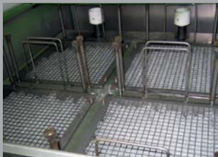
Ejemplo de aspiración en un tanque centralizado

El equipo funciona de acuerdo a las leyes de Stokes y D'arcy.