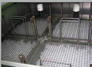
详细视图：朝向介质框观察

LFOS 系统根据“不同液体可以经由保持体相对渗透”的原理工作。保持体位于介质框之中，并且经久耐用，几乎没有时间限制。如果污染严重，可以冲洗保持体。